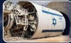
אספקה והפעלה במקביל של 24 מכונות TBM