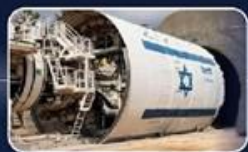
אספקה והפעלה במקביל של 24 מכונות TBM