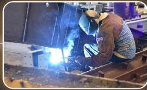
ניהול אסטרטגי של המכרזים