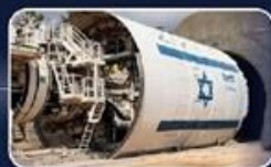
אספקה והפעלה במקביל של 24 מכונות TBM