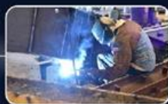
ניהול אסטרטגי של המכרזים