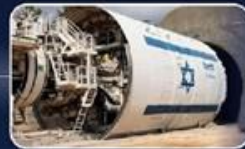
אספקה והפעלה במקביל של 24 מכונות TBM