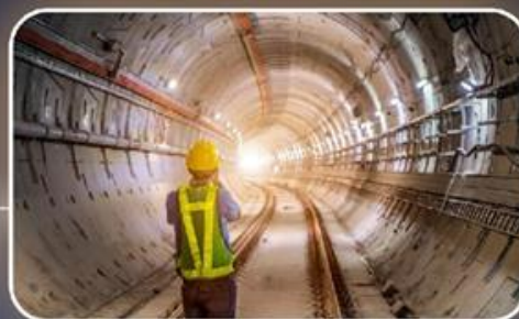
גיוס הון אנושי מקצועי בקנה מידה חסר תקדים