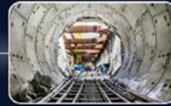
הקמת מפעלים לייצור אלמנטים