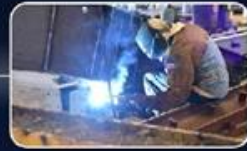
ניהול אסטרטגי של המכרזים