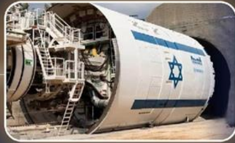
אספקה והפעלה במקביל של 24 מכונות TBM