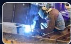
ניהול אסטרטגי של המכרזים