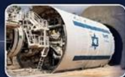
אספקה והפעלה במקביל של 24 מכונות TBM