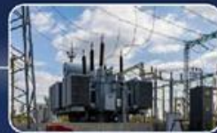
תחנת כח - עצמאות אנרגטית