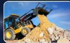
40 מ"ק של עודפי עפר