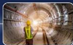
גיוס הון אנושי מקצועי בקנה מידה חסר תקדים