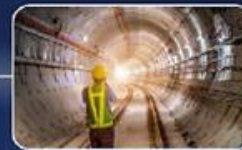
גיוס הון אנושי מקצועי בקנה מידה חסר תקדים