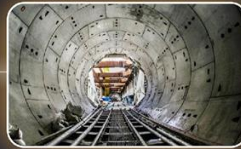
הקמת מפעלים לייצור אלמוטים