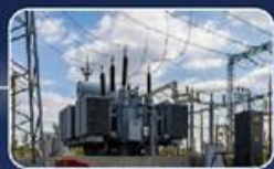
תחנת כח - עצמאות אנרגטית