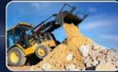
40 מ"ק של עודפי עפר