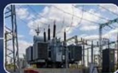
תחנת כח - עצמאות אנרגטית