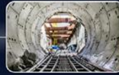
הקמת מפעלים לייצור אלמנטים