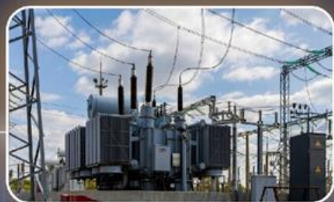
תחנת כח - עצמאות אנרגטית