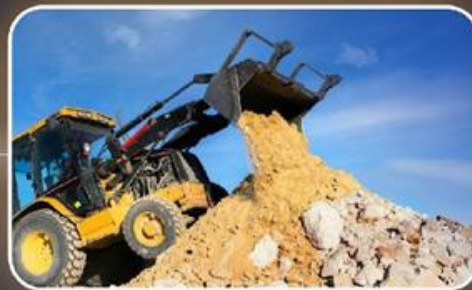
40 מ"ק של עודפי עפר