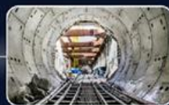
הקמת מפעלים לייצור אלמנטים