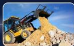
40 מ"ק של עודפי עפר